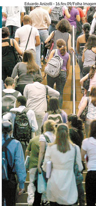
Estudantes na Uninove, em SP

» Fies (crédito educativo) » ProUni (bolsas de estudo)