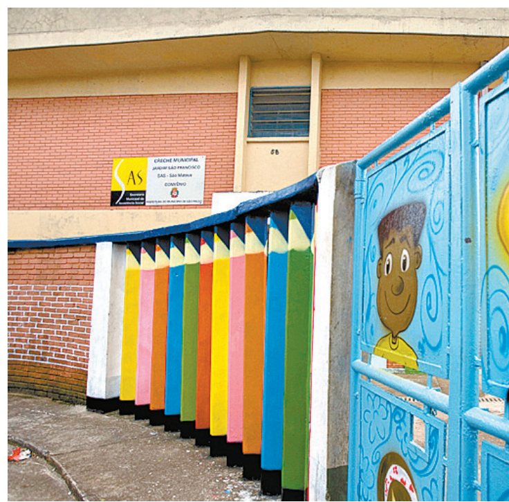
Fachada da creche depredada e pichada; aulas foram suspensas

A Secretaria Municipal da Educação informou que está acompanhando, por meio da Diretoria Regional de São Mateus, o caso e vai auxiliar a entidade responsável pela creche. O órgão confirmou que a reabertura do local deve acontecer amanhã.